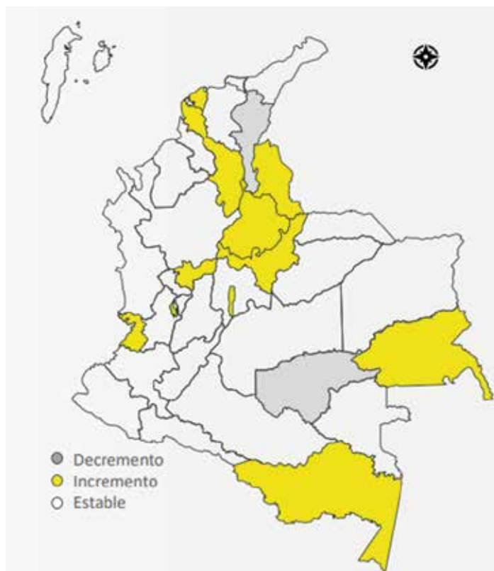
Figura 1: Comportamiento inusual de notificación de evento de interés: intento de suicidio en Colombia, periodo 2021-2022.

Tomado de: Informe de evento: INTENTO DE SUICIDIO - 2022, Instituto Nacional de Salud Colombiano..