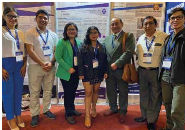
Figura 4. Delegación de docente y alumnos de la FMH-DAC.