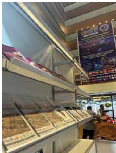
Figura 1. Exhibición de la Revista Médica Panacea en el congreso ASPEFAM.