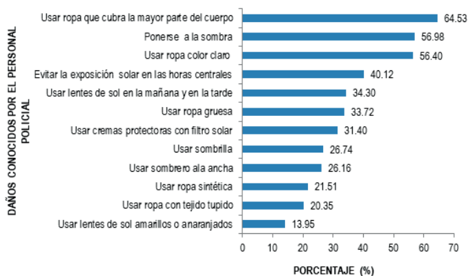
Gráfico 4: MEDIDAS DE FOTOPROTECCIÓN PRACTICADAS FUERA DE LAS HORAS DE TRABAJO POR EL PERSONAL POLICIAL DE LAS COMISARIAS DE LA PROVINCIA DE ICA. 2016

Las tres medidas de fotoprotección que realiza el personal policial fuera de las horas de trabajo son: uso de ropa que cubra la mayor parte del cuerpo (64,53%), ponerse a la sombra (56,98%), uso de ropa color claro (56,40%). También se mencionaron: evitar la exposición solar en las horas centrales (40,12%), uso de lentes de sol en la mañana y en la tarde (34,30%), uso de ropa gruesa (33,72%), uso de cremas protectoras con filtro solar (31,40%), uso de sombrilla (26,74%), uso de sombrero ala ancha (26,16%), uso de ropa sintética (21,51%), uso de ropa con tejido tupido (20,35%) y uso de lentes de sol amarillos o anaranjados (13,95%).