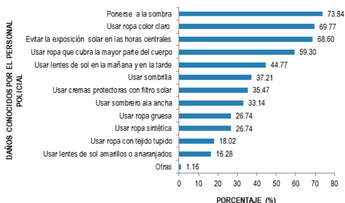
Gráfico 3: MEDIDAS DE FOTOPROTECCIÓN PRACTICADAS DURANTE LAS HORAS DE TRABAJO POR EL PERSONAL POLICIAL DE LAS COMISARIAS DE LA PROVINCIA DE ICA. 2016

Las prácticas de fotoprotección más frecuentes que el personal policial encuestado realiza durante las horas de trabajo son: ponerse a la sombra (73,84%), uso de ropa de color claro (69,77%), evita la exposición solar en las horas centrales (68,60%) y el uso de ropa que cubra la mayor parte del cuerpo (59,30%). Estas fueron seguidas por el uso de lentes de sol en la mañana y en la tarde (44,77%), uso de sombrilla (37,21%), uso de cremas protectoras con filtro solar (35,47%), uso de sombrero ala ancha (33,14%), uso de ropa gruesa (26,74%), uso de ropa sintética (26,74%), uso de ropa con tejido tupido (18,02%) y uso de lentes de sol amarillos o anaranjados (16,28%).