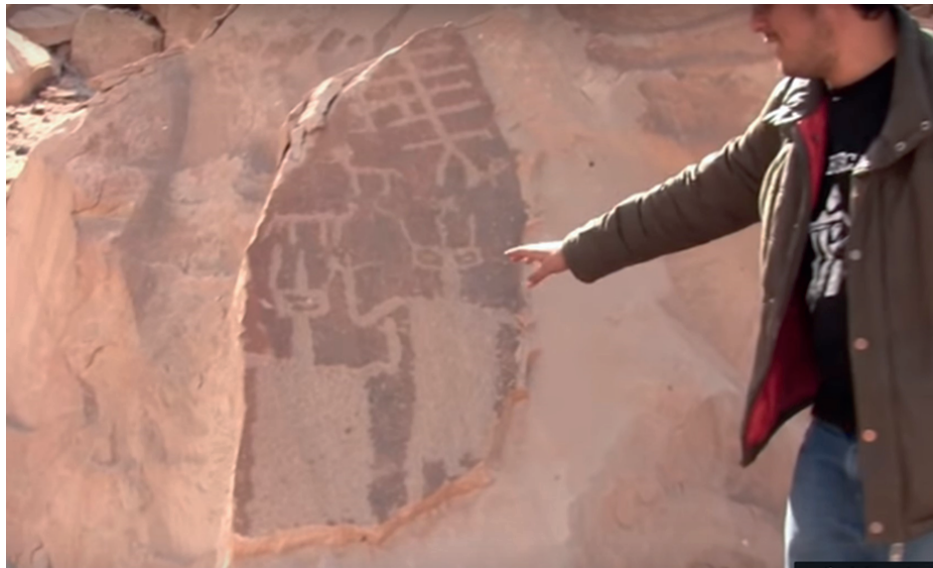
Figura 3. Petroglifos de Chichictara (Palpa-Ica, Perú) cerca de las líneas de Nasca.

De confirmarse por análisis genético de ADN que se trata de una especie diferente a la humana, se demostraría que en el antiguo Perú coexistió otra forma de vida inteligente conviviendo con la raza humana; aun así, surgirían muchas preguntas de investigación sobre su origen, rol, implicancias, legado y desaparición del planeta tierra. Se hace un llamado a la academia e instituciones involucradas de nuestro país a sumar esfuerzos para liderar la investigación científica que requiere dilucidar este enigmático e impactante hallazgo.