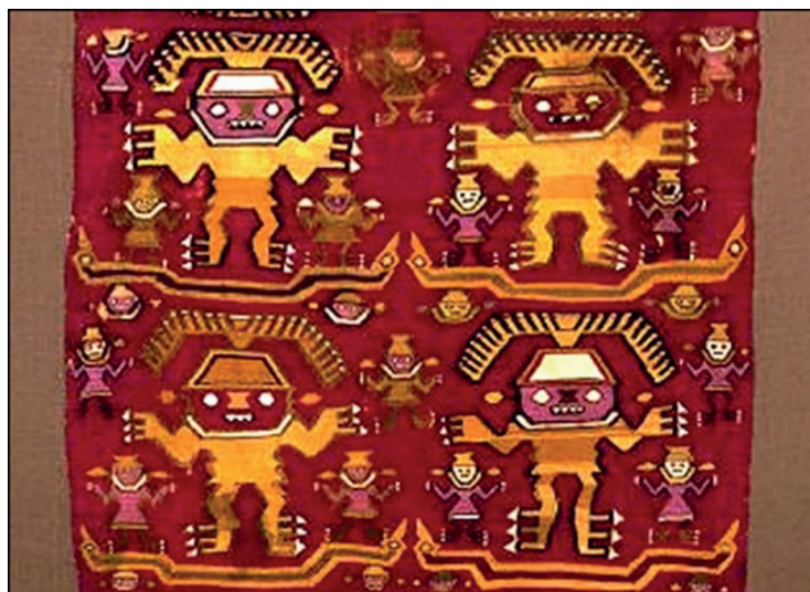
Figura 2. Evidencias iconográficas tridáctilas en petroglifos, textiles, esculturas y cerámicos en múltiples culturas prehispánicas americanas.

Es importante enfatizar que este gran hallazgo bioarqueológico ocurre en las tierras de Nasca-Perú, donde ya existen estructuras enigmáticas como los gigantescos geoglifos "líneas de Nasca" solo visibles desde el aire, o los pozos hidráulicos espiralados de Nasca que son acueductos que evidencian una notable tecnología en ingeniería hidráulica. Otros hallazgos arqueológicos que podrían respaldar la coexistencia en tiempos precolombinos de estos seres tridáctilos es la abrumadora evidencia iconográfica tridáctila (conjunto de imágenes o representaciones de seres de tres dedos) (9) en geoglifos, petroglifos, textiles, esculturas, cerámicos en múltiples culturas prehispánicas no solo del Perú (Fig. 2 y 3), sino de México, Ecuador, Venezuela, Bolivia, Argentina, Colombia y Centroamérica. Esta coincidencia no puede ser producto de una imaginación colectiva ocurrida entre culturas distantes en tiempo y espacio.