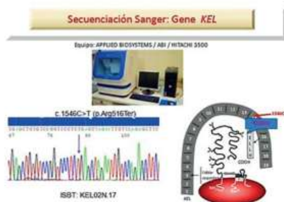
Figura 2. Secuenciamiento usando el método Sanger en el que se muestra el polimorfismo c.1546C>T en la paciente con fenotipo K 0 .